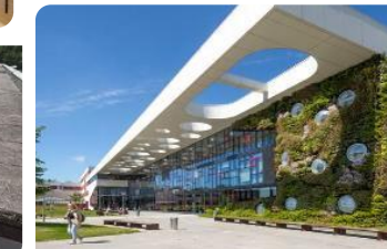
Circulaire bebouwing en klimaatadaptatie