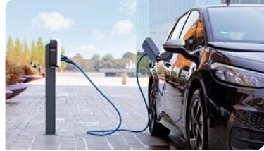
Meer vraag naar multimodale bereikbaarheid en duurzame mobiliteit