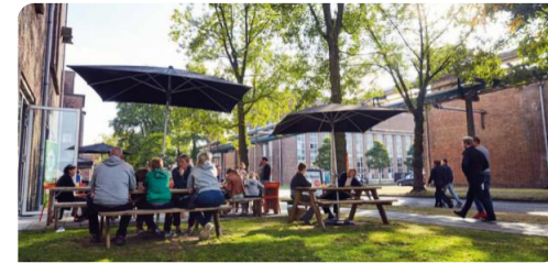
Gezonde- en prettige werkomgeving