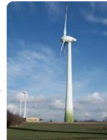
Energietransitie; zon, wind, smart grid