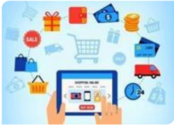
Digitalisering, robotisering: online winkelen, 3d-printing, automatisering